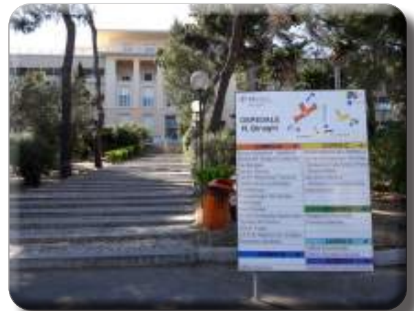
Ospedale Binaghi-Sede Centro Reg. Trapianti