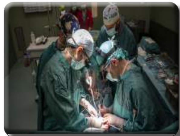
Medici e infermieri durante un trapianto d'organo