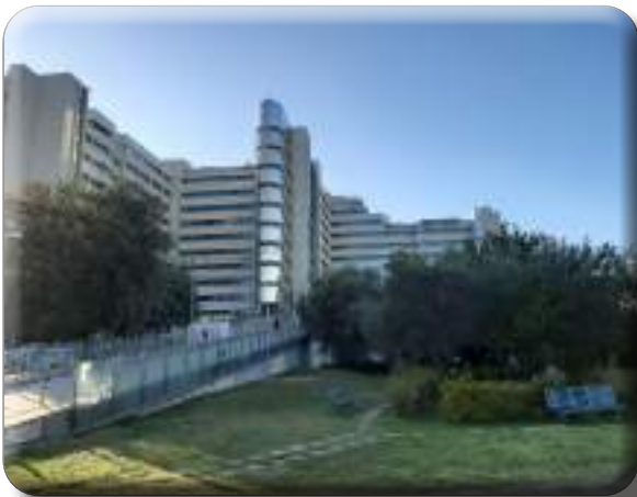
Ospedale G. Brotzu-Sede Centri Trapianto

Le proposte per contribuire a migliorare il sistema trapianti e per garantire ai sardi che ne hanno bisogno, la possibilità di un trapianto nella nostra Isola