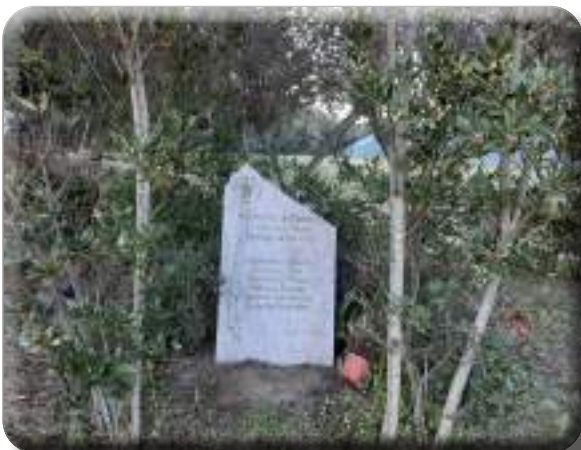
"G. Brotzu"-Lapide in ricordo medici e piloti