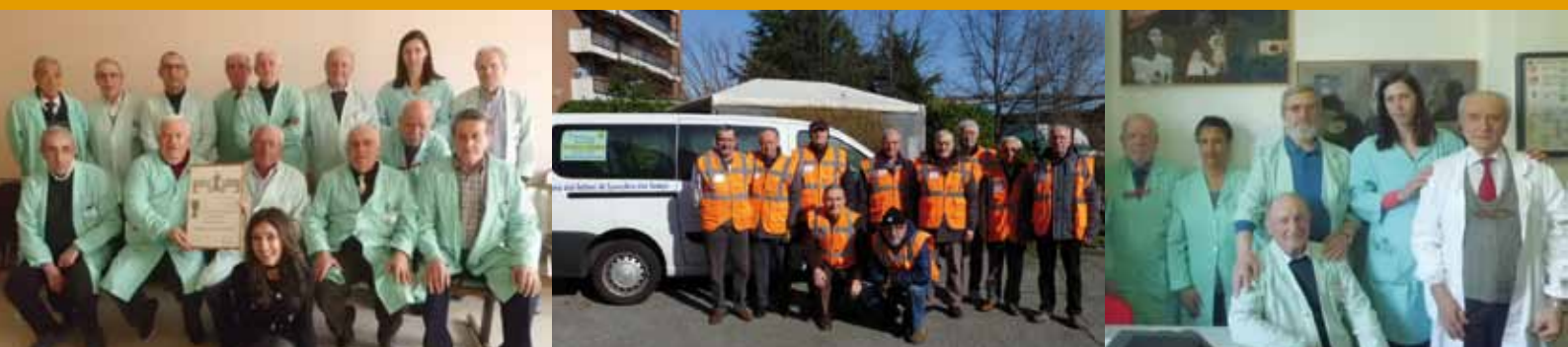
Alcune immagini dei volontari dell'AITF in servizio presso la residenza Cimabue e l'Ospedale Molinette di Torino

SPECIALE Medaglia d'Argento al Merito della Sanità Pubblica