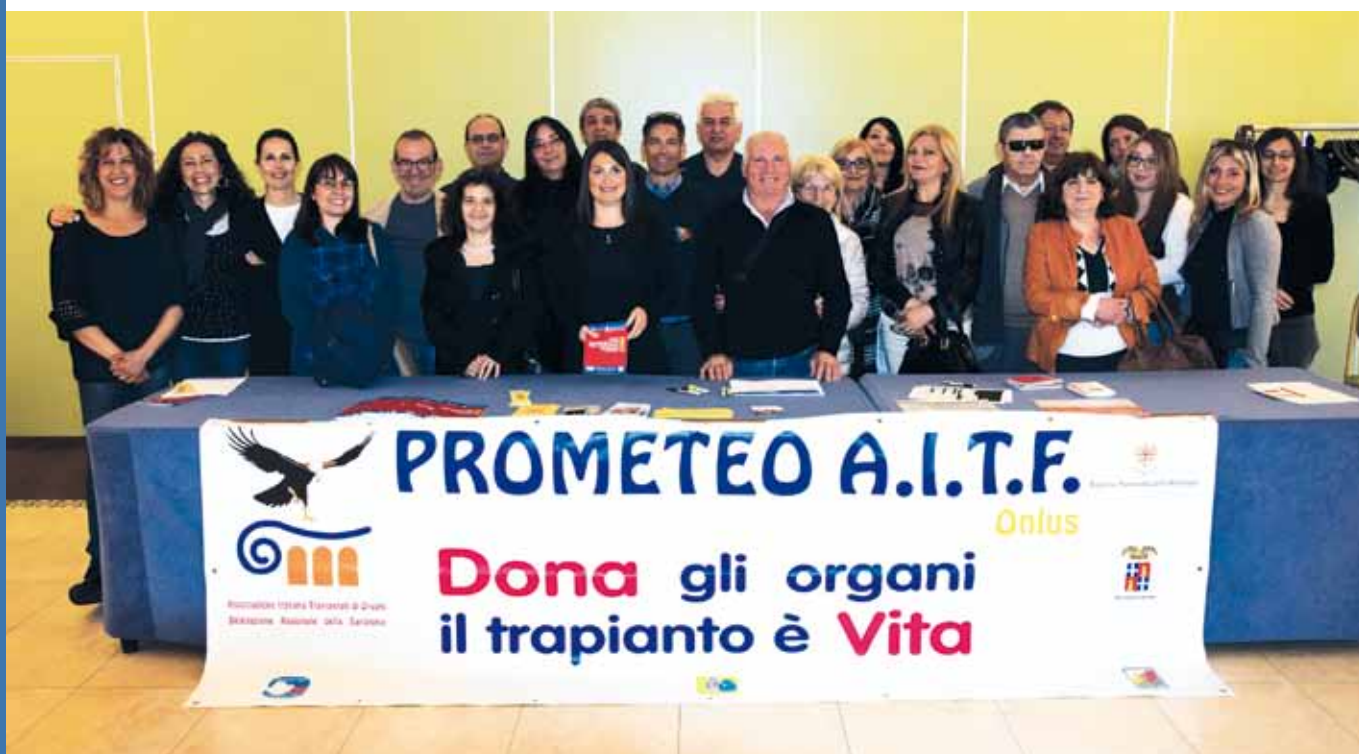
Foto di gruppo dell'Assemblea Soci Prometeo Aitf