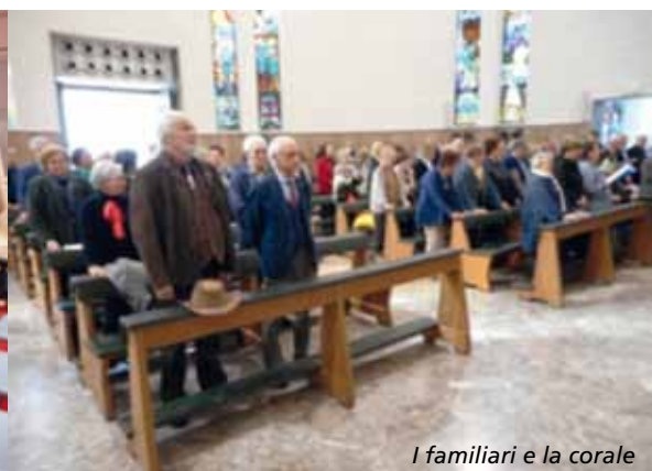
I familiari e la corale