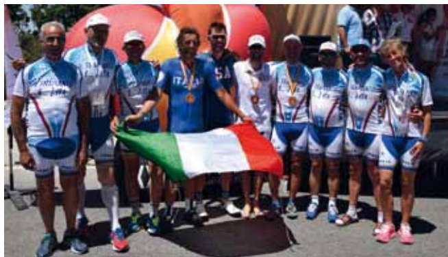
Foto a sinistra: i ciclisti italiani.