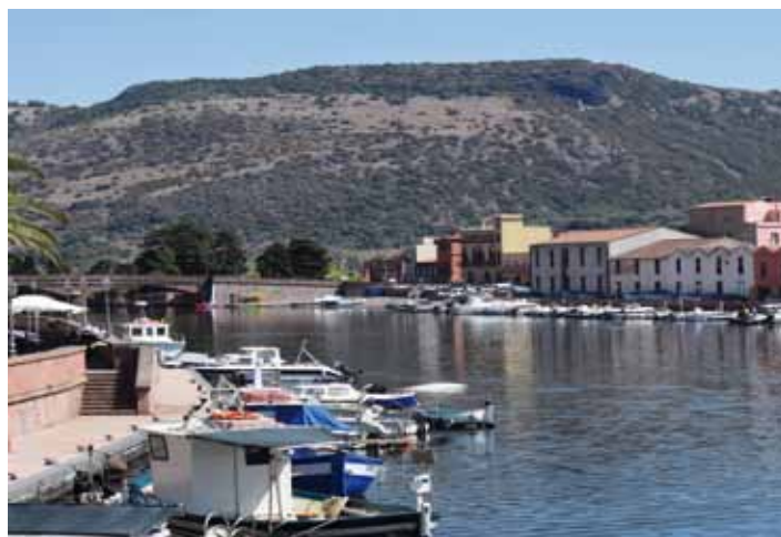
Bosa - Veduta dal Temo