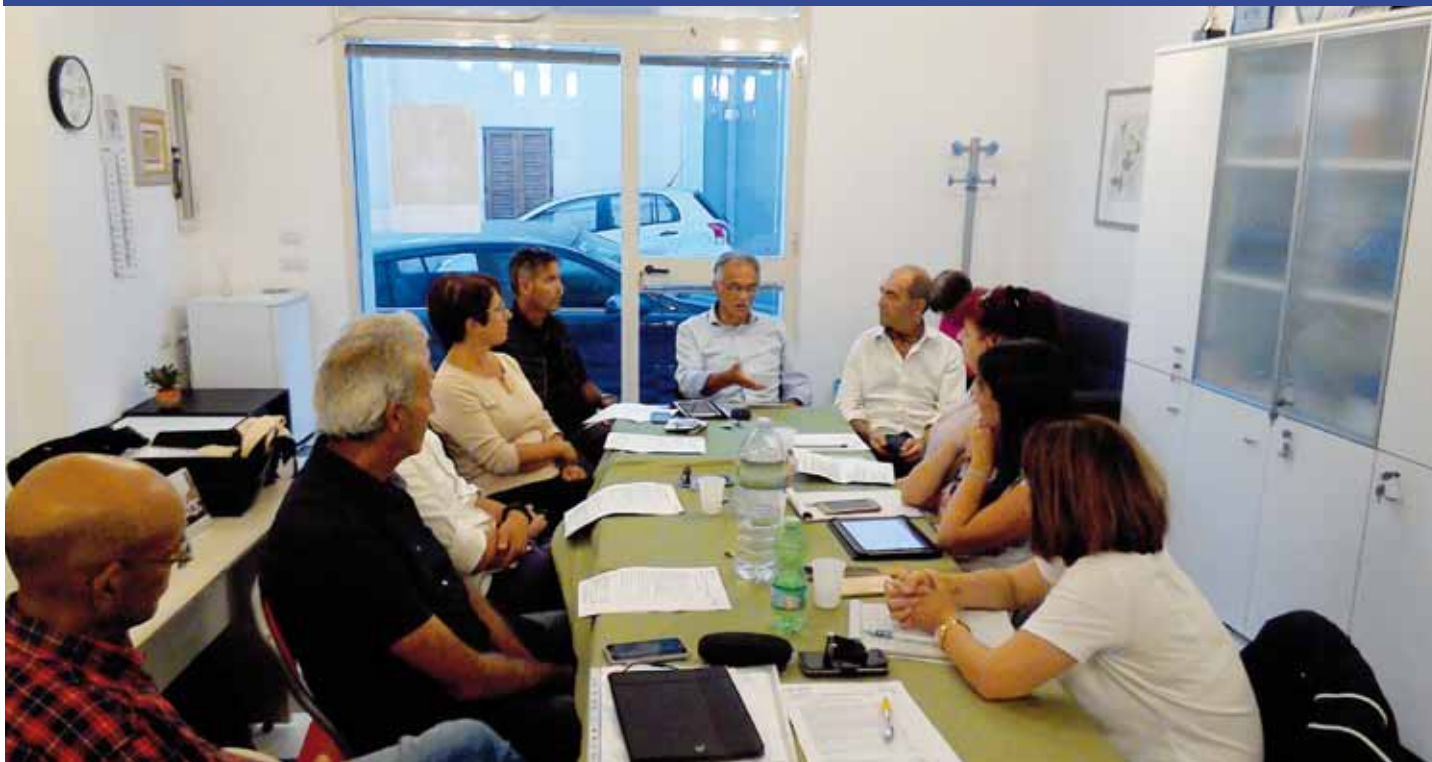
Il Consiglio Direttivo della Prometeo Aitf Onlus Regionale in una delle tante riunioni dell'organismo