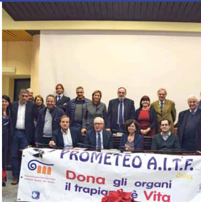
Quartu S.E. - Gruppo dopo la manifestazione