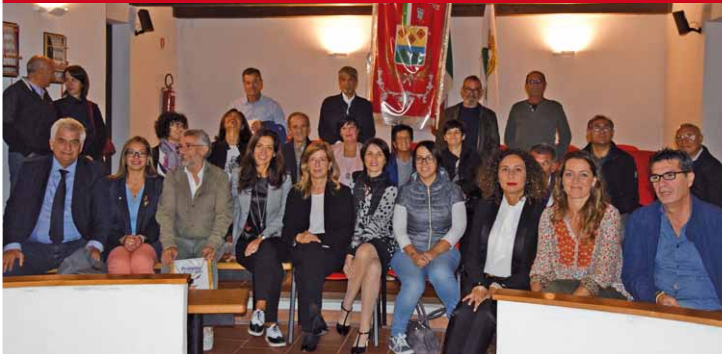
Comune di Aggius - Foto di gruppo di volontari, medici, amministratori e cittadini dopo la manifestazione