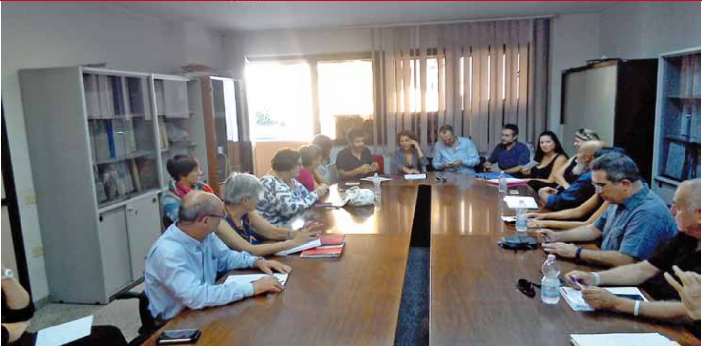
Riunione di volontari della Accademia del Cittadino - "Tramas" per avere cittadini consapevoli

Dopo tanti incontri che hanno coinvolto 37 Onlus e ben 45 loro volontari si è conclusa una prima fase dei lavori del progetto della Regione Sardegna "Accademia del Cittadino - Tramas", che punta a formare cittadini consapevoli e preparati per aiutare a migliorare le cure. Il progetto, partito lo scorso anno, ha avviato un processo a lunga scadenza e prende spunto dal lavoro che in altre Regioni (Emilia Romagna e Toscana) è già cominciato diversi anni fa.