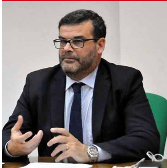
L'Assessore Regionale alla Sanità Luigi Benedetto Arru