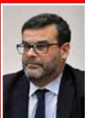
Angelo Benedetto Arru Assessore Regionale alla Sanità della Regione Sardegna