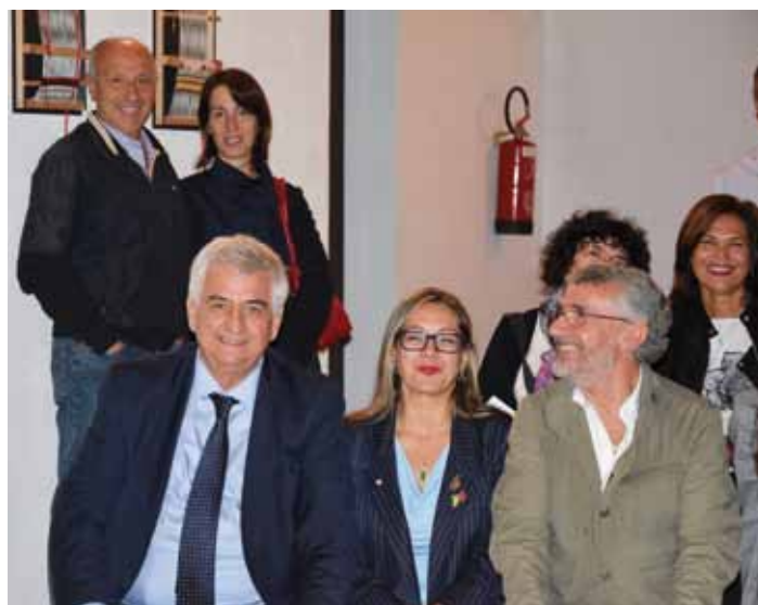
Presidenti Prometeo e Avis di Tempio con il Sindaco di Aggius