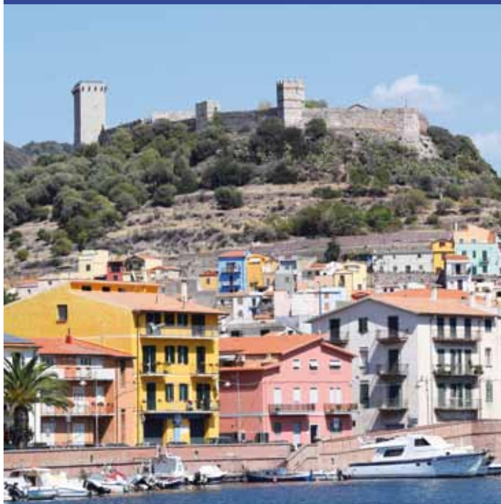
Bosa - Veduta dal Temo