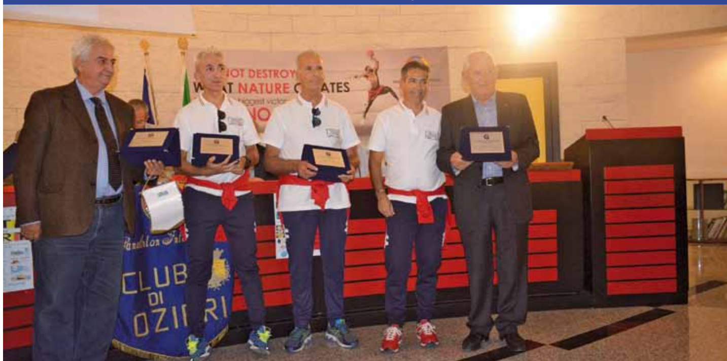
Ozieri-Dirigente e Atleti della Prometeo sport premiati dal Panathlon per la presenza a Malaga

Il 28 ottobre 2017, a Ozieri, il Panathlon Club ha premiato vari atleti sardi che, nel corso dell'anno, si sono particolarmente distinti.