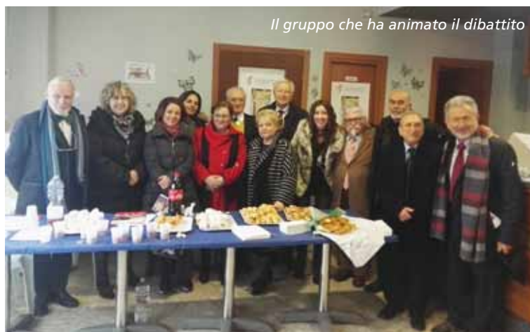
Il gruppo che ha animato il dibattito