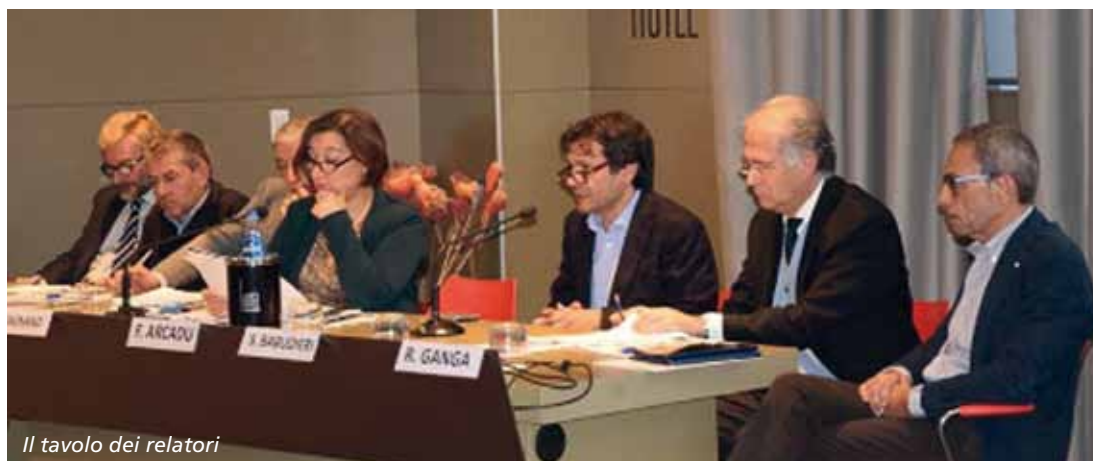
Il tavolo dei relatori