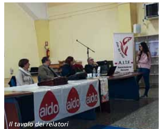
Il tavolo dei relatori