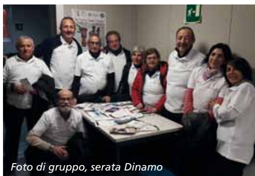
Foto di gruppo, serata Dinamo