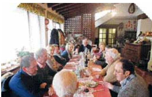
Il Tavolo dei lavori del Direttivo – Trattoria AL CIAVEDAL di Pagnacco