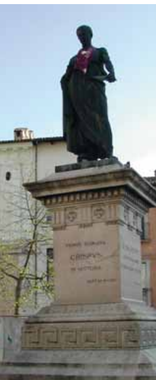
L'Aquila, Piazza Palazzo, Monumento Gaio Sallustio Crispo.

È recente la discussione nata da un'infelice frase del Presidente degli Stati Uniti di America che qualificava negativamente alcuni stati centro-sudamericani. La risposta di Trump alle critiche fu che Lui era, malgrado tutto, un "genio". È opportuno quindi dissertare sull'etimologia di queste tre semplici parole: Genio, intelligenza e cultura.