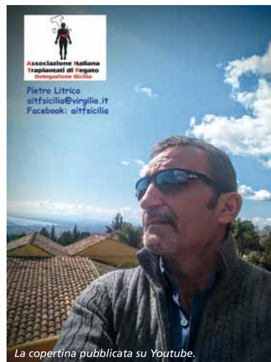
La copertina pubblicata su Youtube.