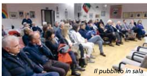
Il pubblico in sala