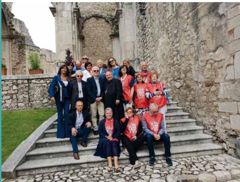
Giornata del Donatore a Sant'angelo dei Lombardi.