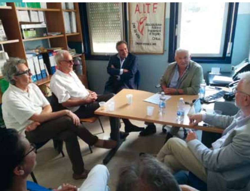
Comitato scientifico Aitf Caserta