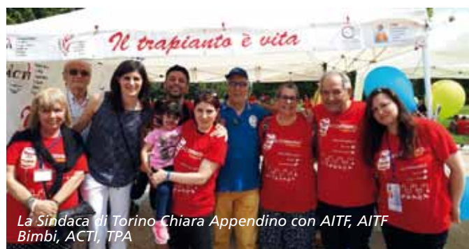
La Sindaca di Torino Chiara Appendino con AITF, AITF Bimbi, ACTI, TPA