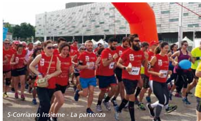
S-Corriamo Insieme - La partenza