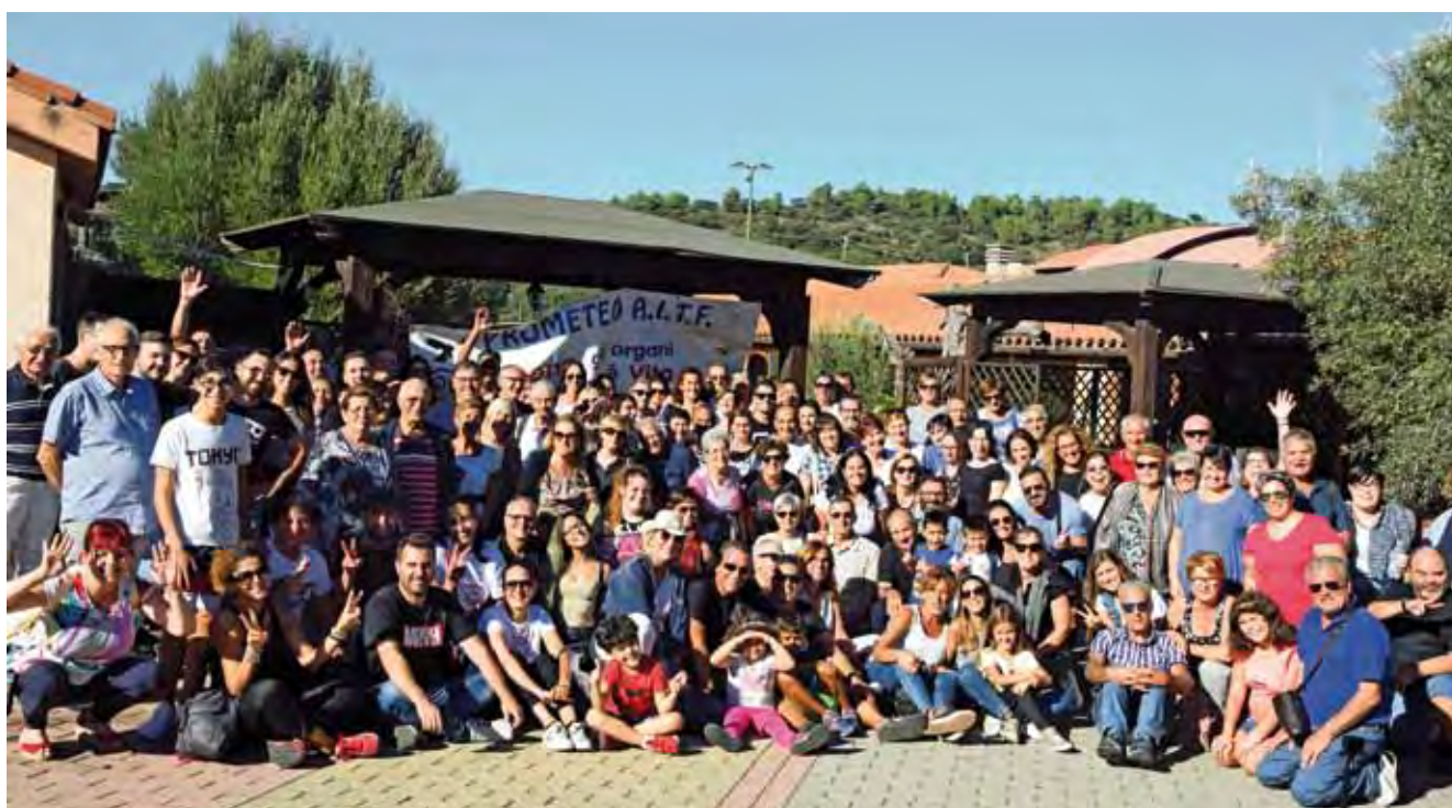
Attività ricreative - Gita sociale a Montevecchio 2018.