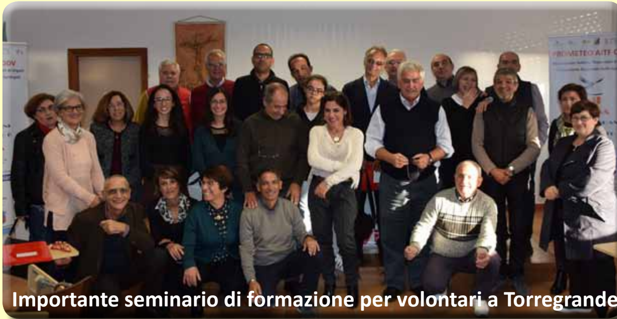
Importante seminario di formazione per volontari a Torregrande