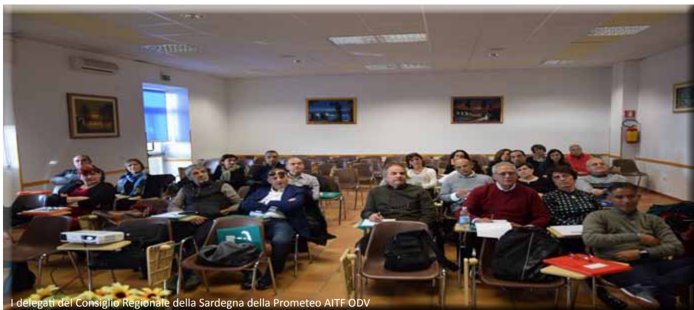
I delegati del Consiglio Regionale della Sardegna della Prometeo AITF ODV