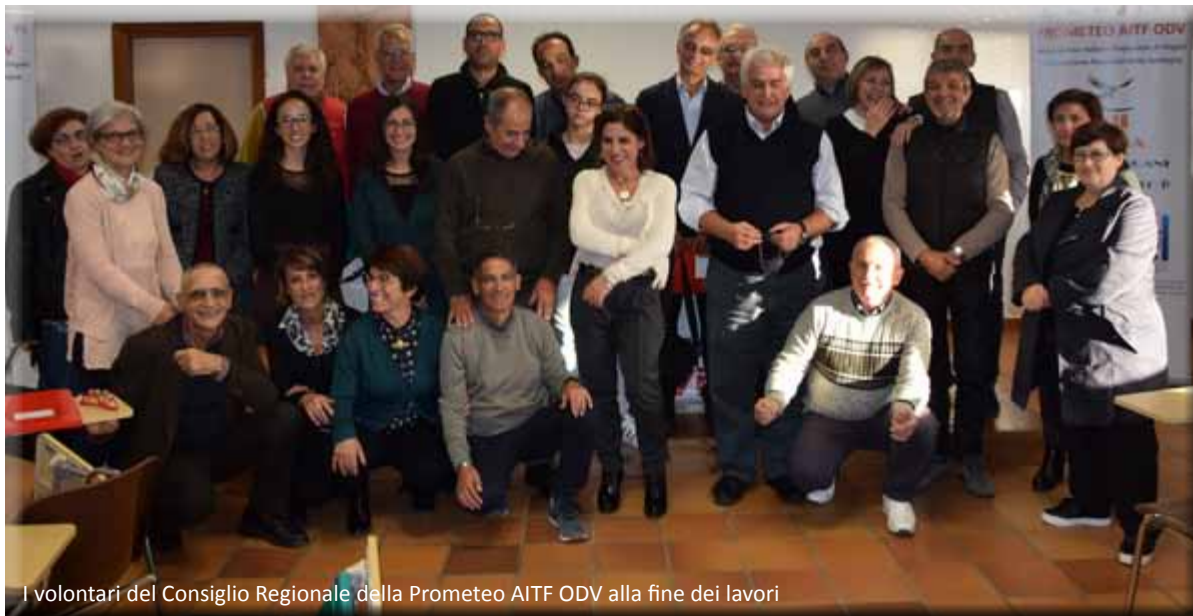
I volontari del Consiglio Regionale della Prometeo AITF ODV alla fine dei lavori

fornito anche alcune indicazioni più tecniche, chiarendo che «non si può non comunicare» - in quanto anche il silenzio e gli atteggiamenti, consapevoli o meno, di chiusura verso gli altri sono comunque forme di comunicazione - e che «in una comunicazione esiste sempre un aspetto di contenuto e uno di relazione», ossia non conta solo ciò che si dice ma anche come lo si dice.