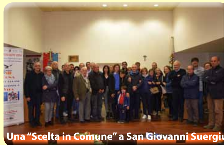
Una "Scelta in Comune" a San Giovanni Suergiu