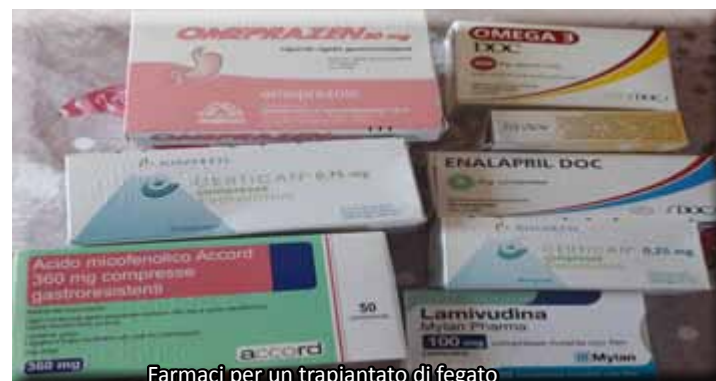
Farmaci per un trapiantato di fegato

2) Abbiamo inoltre ribadito di comune accordo