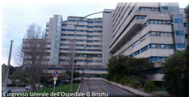
L'ingresso laterale dell'Ospedale G. Brotzu

Per prima cosa, abbiamo sollevato il problema della carenza di personale medico e infermieristico al D.H. della Chirurgia generale, aggravato in questo periodo dall'assenza per malattia di una gastroenterologa. Abbiamo anche fatto presente che il carico di lavoro del D.H. si è ormai notevolmente aggravato in quanto in questa struttura sono attualmente seguiti anche pazienti trapiantati fuori dalla Sardegna, in precedenza assistiti da professionisti in servizio al "G. Brotzu" ora in quiescenza.