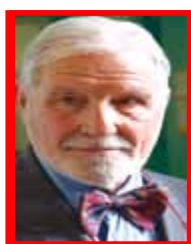
Marco Borgogno Presidente Nazionale AITF Onlus