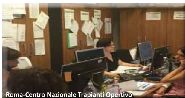
Roma-Centro Nazionale Trapianti Operativo