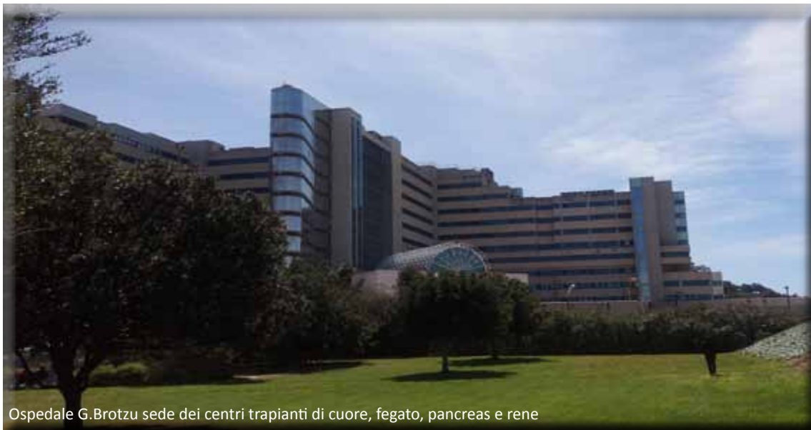
Ospedale G. Brotzu sede dei centri trapianti di cuore, fegato, pancreas e rene