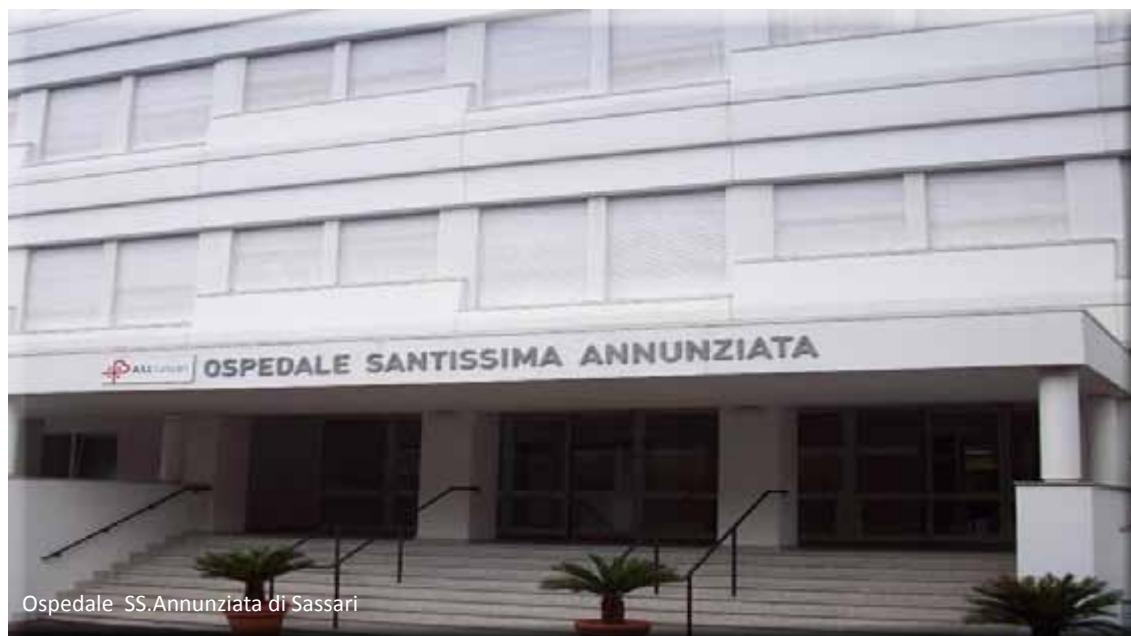
Ospedale SS. Annunziata di Sassari