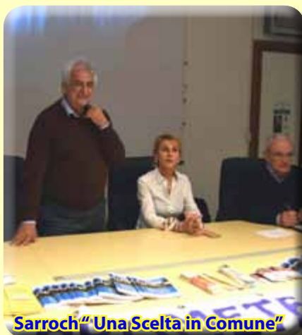
Sarroch "Una Scelta in Comune"