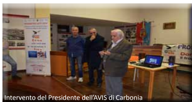
Intervento del Presidente dell'AVIS di Carbonia