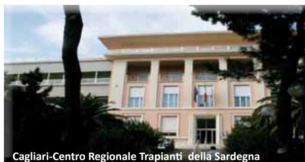
Cagliari-Centro Regionale Trapianti della Sardegna