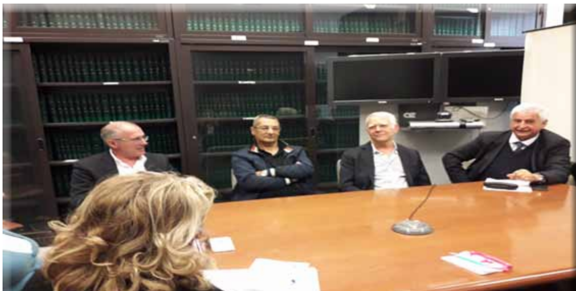
Foto dei partecipanti al primo incontro su farmaci tenuto in Assessorato Regionale alla Sanità nel 2018