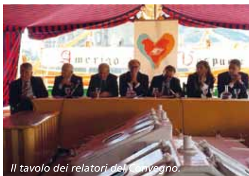
Il tavolo dei relatori del convegno.