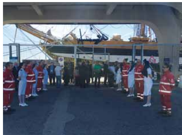
Convegno organizzato dall'ASL Napoli 1 e dal Centro Regionale Trapianti sulla nave-scuola Amerigo Vespucci.