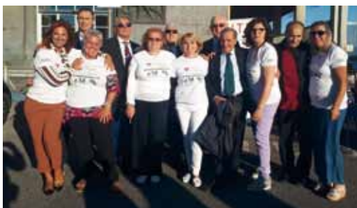
Alcuni Volontari della Delegazione AITF Campania.

considerata il nemico del momento. Ma quando la fiammata di solidarietà si spegne, chi viveva in solitudine si ritrova spesso senza punti di riferimento il che induce non di rado alla disperazione.