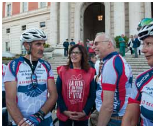
Riprese in occasione della Granfondo.