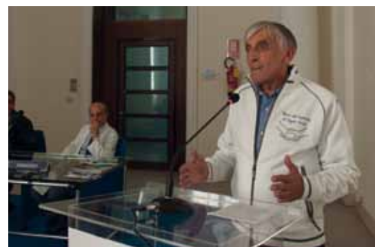
Riprese in occasione dell'evento conclusivo all'Ospedale Caldarelli di Napoli, prima tappa Granfondo.