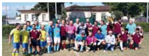
Panoramica delle squadre.

Il tutto si è svolto in un clima di cordialità ed amicizia, conditi da un sano agonismo sportivo che ha fatto proporre ai presenti di ampliare e migliorare l'iniziativa per gli anni futuri. Alla fine un momento conviviale ha cementato le esperienze comuni.