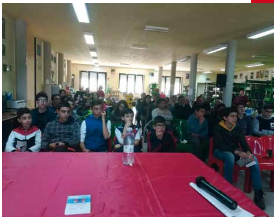
Riprese in occasione della manifestazione di Lula.