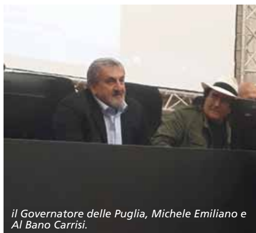
il Governatore delle Puglia, Michele Emiliano e Al Bano Carrisi.