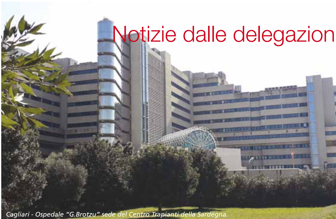
Cagliari - Ospedale "G. Brotzu" sede del Centro Trapianti della Sardegna.