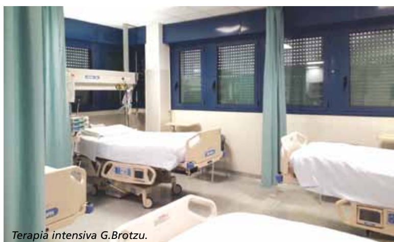
Terapia intensiva G.Brotzu.

Un incremento degli organici del D.H. permetterebbe anche di eseguire più rapidamente le visite pre-trapianto per tutti i pazienti epatopatici già seguiti al "G. Brotzu", o a questo indirizzati da altre strutture ospedaliere di tutta la Sardegna, per essere inseriti in lista di attesa per un trapianto.