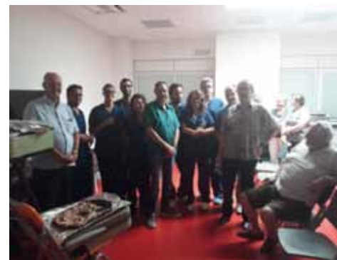
Associati e personale sanitario.