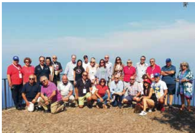
I partecipanti alla prima edizione della Cento Miglia della Calabria