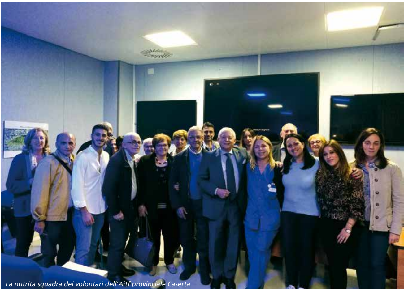
La nutrita squadra dei volontari dell'Aitf provinciale Caserta