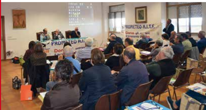
Il pubblico in sala durante la manifestazione a Torregrande