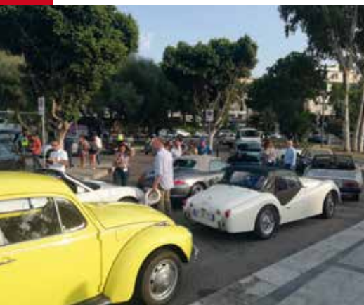
Alcune auto che hanno preso parte alla manifestazione