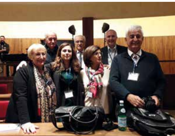
Il gruppo Aitf