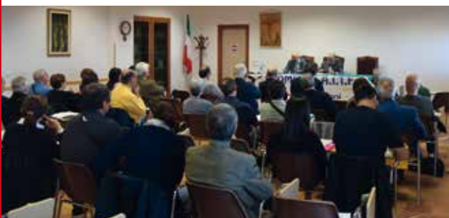
La sala di Torregrande