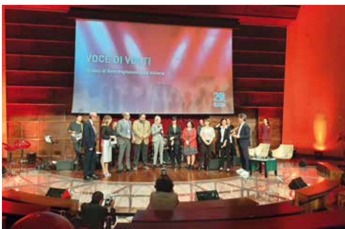
Il personale CNT operativo