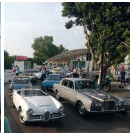
Le auto mentre rifiatano sul lungomare di Reggio Calabria