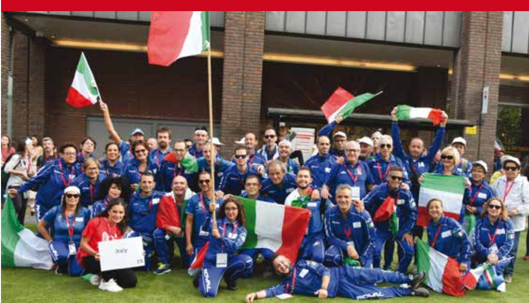
L'Italia al WTG di New Castle 2019

NEWCASTLE: LA PRIMA VOLTA DEI DONATORI VIVENTI