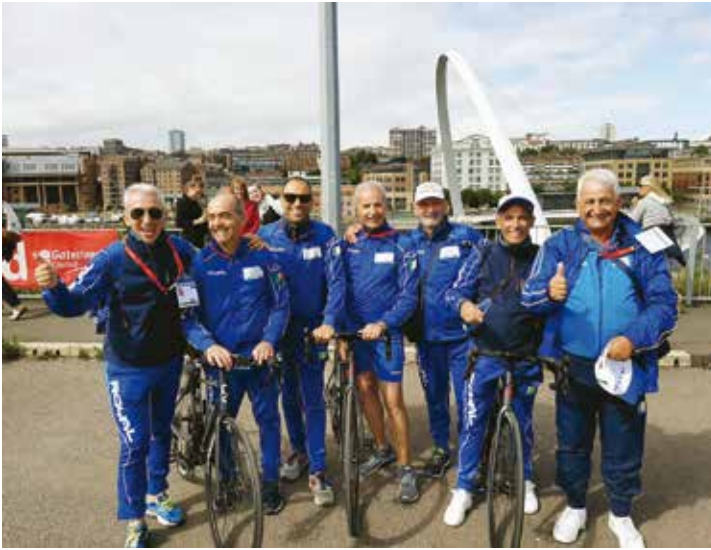
Atleti Aitf al WTG di New Castle