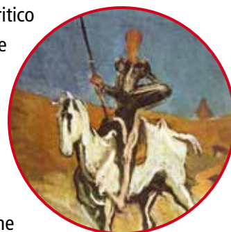
Don Chisciotte e Ronzinante, dipinto di Honoré Daumier*