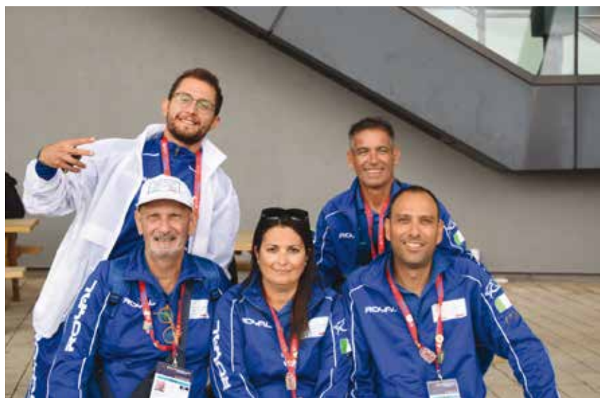
Gli Atleti della Petanque