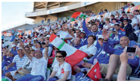
Malaga- Giochi mondiali WTG 2017