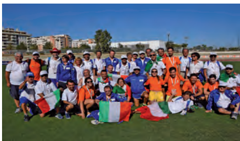
Malaga- Giochi mondiali WTG 2017