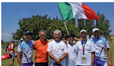
Quartu S.E. - Atleti sardi per gli europei ETDSC 2018