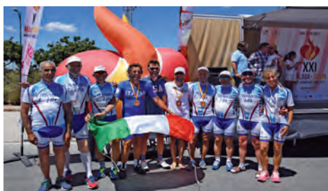
Malaga- I ciclisti trapiantati dell'Italia ai WTG 2017